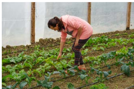
La Svizzera sostiene delle aziende agricole nella commercializzazione dei loro prodotti a Bucarest e Ploiești.

Per molte PMI rumene che non sono in grado di fornire sufficienti garanzie è difficile riuscire a ottenere un prestito. Per questo la Svizzera partecipa, con un importo di 24,5 milioni di franchi, a un fondo che consente alle PMI meritevoli di credito di otto settori selezionati di accedere più facilmente al mercato del credito. Da questo fondo, un'importante banca commerciale rumena concede prestiti garantiti per un massimo di 300'000 franchi al fine di aumentare la competitività e gli investimenti delle PMI. Alla fine del 2018 ne aveva concessi più di 460, che hanno permesso di garantire finora circa 3000 posti di lavoro.