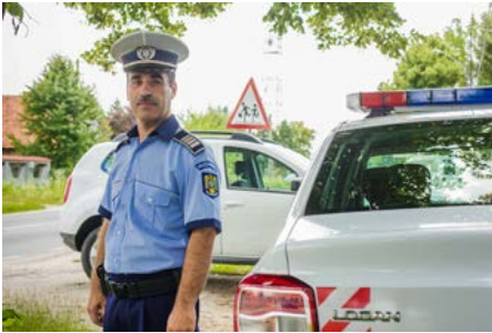
Grazie ad apposite formazioni i poliziotti familiarizzano con la lingua e la cultura dei Rom riuscendo a conquistarne la fiducia. Questo facilita la risoluzione dei problemi nella comunità.

La magistratura rumena ha formato circa 10'000 giudici e procuratori pubblici sull'applicazione delle nuove norme penali. L'applicazione delle leggi è facilitata anche dai manuali di formazione distribuiti in tutto il Paese.