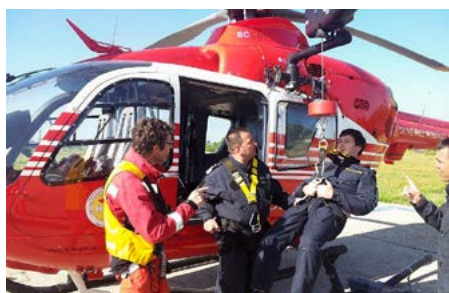
Forte della sua vasta esperienza pluriennale, la Rega concorre a migliorare i servizi di soccorso rumeni.

Nell'ambito di un partenariato, la Guardia aerea svizzera di soccorso (Rega) ha organizzato e coordinato corsi di perfezionamento per piloti di elicottero rumeni. Nel corso di 47 moduli di esercitazione 34 piloti hanno perfezionato le loro competenze di volo. Inoltre, 30 fra meccanici di volo e di bordo hanno seguito una formazione di base sul tema della sicurezza.