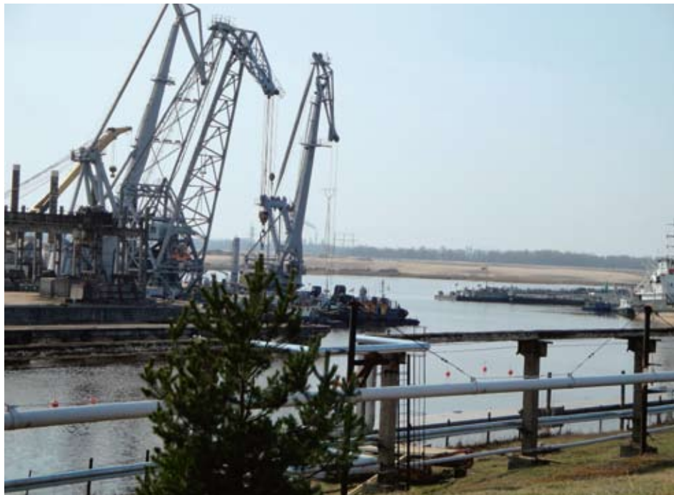
En Lettonie, la Suisse prévoit de soutenir à hauteur de 13 millions de francs l'assainissement de la zone de Sarkanda, contaminée par le pétrole, dans le port industriel de Riga (en illustration). Cette action permettra également de stopper la pollution de la rivière Daugava, qui se jette dans la mer Baltique.