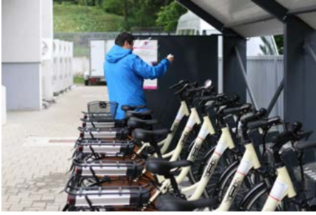
Suceava promeut la mobilité électrique afin de faire baisser les coûts de l'énergie et de réduire la pollution de l'air et le bruit dans la ville.