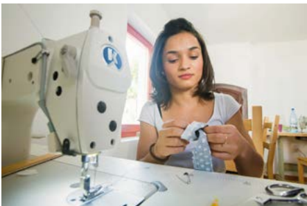
De nombreux travailleurs qualifiés quittent la Roumanie faute de perspectives d'avenir. Des établissements sociaux reçoivent un soutien afin de pouvoir offrir à la population des perspectives professionnelles et sociales.

En Roumanie, une quarantaine de projets de partenariat stimulent l'échange de connaissances et d'expériences entre des organisations de la société civile suisses et roumaines. Environ 200 experts ont pu bénéficier de ces échanges dans divers domaines, tels que la protection de l'environnement, les services sociaux ou la santé. Environ 100 ONG roumaines actives dans ces domaines ont également reçu un soutien financier afin qu'elles puissent développer leurs capacités institutionnelles. En tant que porte-parole de la société civile, elles participent activement aux processus de prise de décision politique.