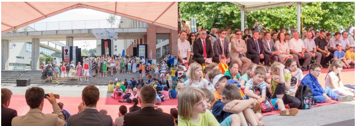
Auftritt der Schüler vor der Gemeinde in Nova Gorica