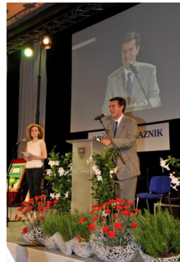
Botschafter Pierre-Yves Fux, Anrede in Velike Lašče

Nach dem schweizer Abend am Filmfestival in Izola fand anschliessend am selben Abend, 100 Kilometer östlicher, in der Gemeinde Velike Lašče, die Gemeindefeier statt, zu welcher die Partnergemeinde Lützelflüh aus der Schweiz eingeladen wurde. Die Gemeindeparkerschaft mit Velike Lašče wurde 2004 in Lützelflüh unterzeichnet und das Resultat sind Jährliche Treffen und eine gemeinsame Kulturbrücke Velike Lašče Lützelflüh.