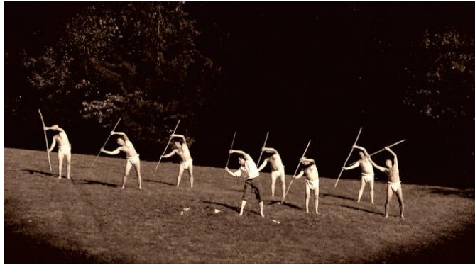
»Nackt und Barfus durch den Morgentau«