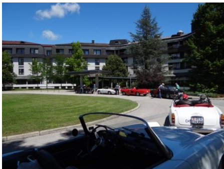
Rally degli Oldtimer

Una ventina di appassionati di veicoli da collezione sono partiti dalla Svizzera questo 20 giugno 2015 per fare un giro dell'Europa centrale per alla fine vedere anche tutti i bei paesaggi della Slovenia. Finalmente si sono ritrovati a Trieste il 27 giugno dopo aver visto le montagne slovene, dopo aver approfittato di Bled e Lubiana e dopo aver guidato per le belle regioni di Dolenjska. Insieme con l'Ambasciatore Pierre-Yves Fux hanno visitato le famose grotte di Postumia per finire la gita con un ricordo di una vista fantastica del mare Adriatico.