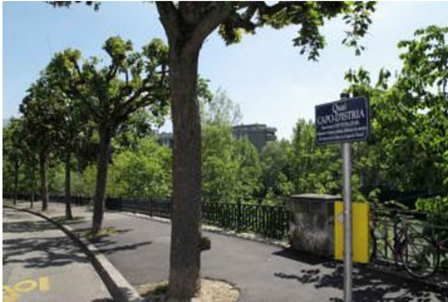
Γενεύη, η όχθη Ίστρια (Capo d'Istria) στον ποταμό Arve

Ο Καποδίστριας ανακηρύσσεται επίτιμος δημότης της Γενεύης το 1815 και, ένα χρόνο αργότερα, του καντονιού του Vaud. Η Γενεύη, από την πλευρά της έδωσε το όνομά του σε μία από τις ωραιότερες όχθες της και μια αναμνηστική πλακέτα αναρτήθηκε στο σπίτι όπου διέμενε κατά το έτος 1820. Δεν γνωρίζω όμως κάποια παρόμοια επίσημη χειρονομία σε επίπεδο Ομοσπονδίας της εποχής εκείνης. Ανεγέρθηκε ωστόσο ένα άγαλμα του Καποδίστρια, κατόπιν ρωσικής πρωτοβουλίας, στα εγκαίνια του οποίου παρευρέθηκε η κ. Calmy-Rey, επικεφαλής του ομοσπονδιακού Υπουργείου Εξωτερικών, δίπλα στον Ρώσο ομόλογό της, τον κ. Serguei Lavron. Αυτά έλαβαν χώρα τον Σεπτέμβριο του 2009, στις ακτές της λίμνης Λεμάν, στη μικρή πόλη Ouchy, κοντά στη Λωζάννη.