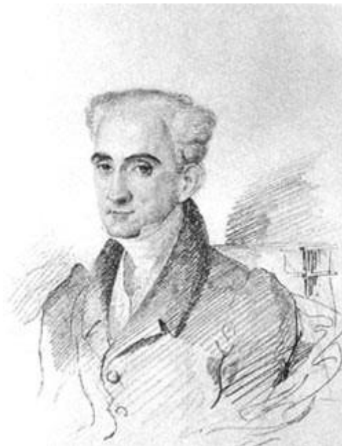
Ο Καποδίστριας, σχέδιο του Brioullon, γύρω στα 1820

Αλέξανδρο Α' να «σώσει (την Ελβετία) από το γαλλικό δεσποτισμό» και να τη συνδράμει ώστε «να ξαναβρεί τον εαυτό της και να λάβει μέρος [...] στο μεγάλο έργο της ευρωπαϊκής αναδόμησης» (Bouvier-Bron, σελ. 19).